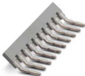
Гребенчатый мостик, Размер шага: 6,2 мм, Полюсов: 10, Цвет: серый

Обратите внимание на то, что приведенные здесь данные взяты из online-каталога. Полная информация и данные содержатся в документации пользователя. Действуют Общие условия использования для информации, загруженной из интернета. ( http://phoenixcontact.ru/download )