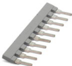
Гребенчатый мостик, Размер шага: 15 мм, Полюсов: 10, Цвет: серый

Обратите внимание на то, что приведенные здесь данные взяты из online-каталога. Полная информация и данные содержатся в документации пользователя. Действуют Общие условия использования для информации, загруженной из интернета. ( http://phoenixcontact.ru/download )