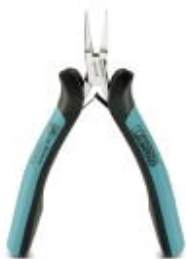
Электронные плоскогубцы, гладкие губки, с открывающей пружиной

Обратите внимание на то, что приведенные здесь данные взяты из online-каталога. Полная информация и данные содержатся в документации пользователя. Действуют Общие условия использования для информации, загруженной из интернета. ( http://phoenixcontact.ru/download )