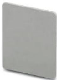
Разделительная пластина, Длина: 14 мм, Ширина: 0 мм, Высота: 16 мм, Цвет: серый

Обратите внимание на то, что приведенные здесь данные взяты из online-каталога. Полная информация и данные содержатся в документации пользователя. Действуют Общие условия использования для информации, загруженной из интернета. ( http://phoenixcontact.ru/download )