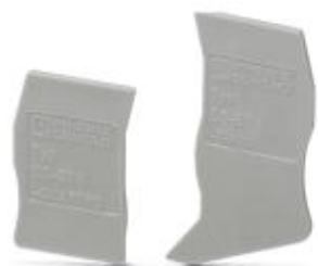
Сегмент крышки, Длина: 87 мм, Высота: 36,5 мм, Цвет: серый

Обратите внимание на то, что приведенные здесь данные взяты из online-каталога. Полная информация и данные содержатся в документации пользователя. Действуют Общие условия использования для информации, загруженной из интернета. ( http://phoenixcontact.ru/download )