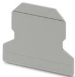
Разделительная пластина, Длина: 56 мм, Ширина: 3 мм, Высота: 45,7 мм, Цвет: темно-серая

Обратите внимание на то, что приведенные здесь данные взяты из online-каталога. Полная информация и данные содержатся в документации пользователя. Действуют Общие условия использования для информации, загруженной из интернета. ( http://phoenixcontact.ru/download )