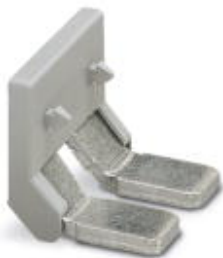
Гребенчатый мостик, Полюсов: 2, Цвет: серый

Обратите внимание на то, что приведенные здесь данные взяты из online-каталога. Полная информация и данные содержатся в документации пользователя. Действуют Общие условия использования для информации, загруженной из интернета. ( http://phoenixcontact.ru/download )